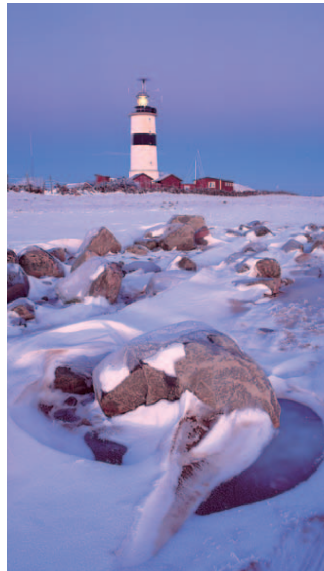
Fyren Morups Tånge.