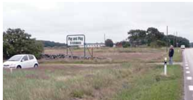
Infart till 5.

Infarter till 3 och 4 dels från "gamla E-6:an", första avtagsvägen österut vid skogsdungen 500 m söder om Bölse kvarn, och dels från vägen mellan Bölse och Breås/Långås, enda avtagsvägen söderut vid ett större skogsparti med ett gult hus närmast infarten (se pil).